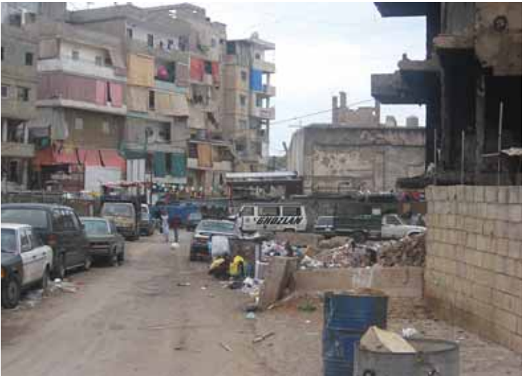
Foto 2 Şatila Yerleşkesi (sol) ve iç savaşın tahrip ettiği binalar (sağ) (Beirut, 13 Mart 2009)