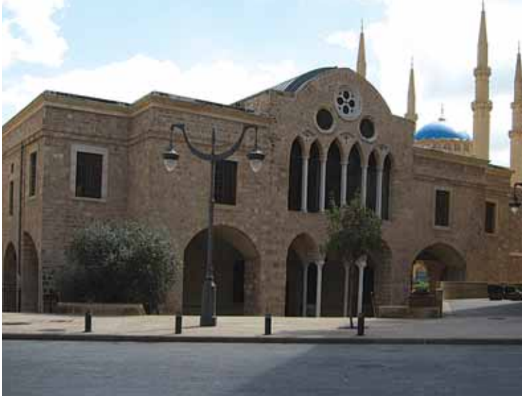
Foto 30 Önde St. George Ortodoks Katedrali, arkada Muhammedu'l-Emin Camii (Beirut, 14 Mart 2009)