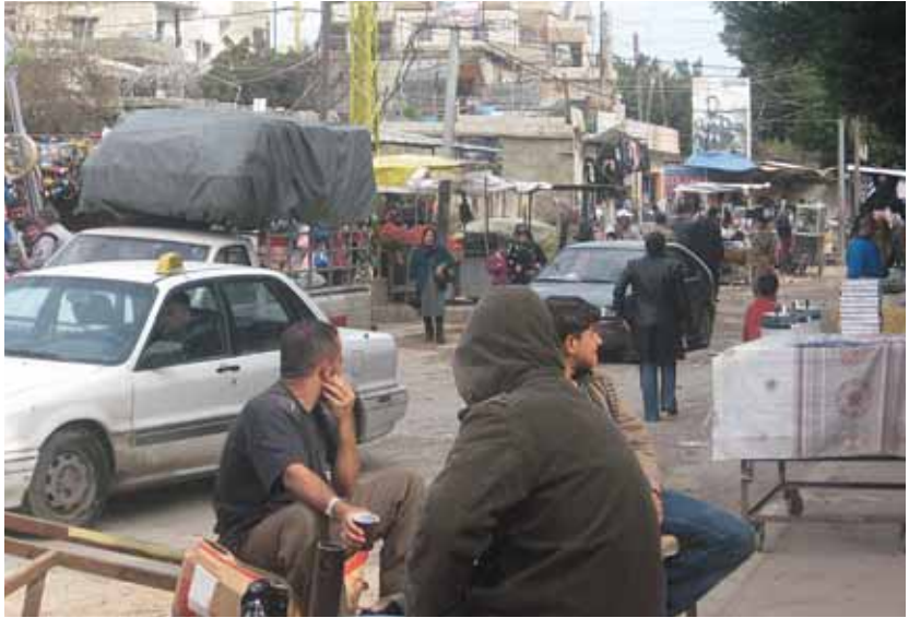
Foto 3 Şatila Kampı'nın dışında Filistinli mültecilerin alışveriş yaptığı mekânlar (Beyrut, 13 Mart 2009)