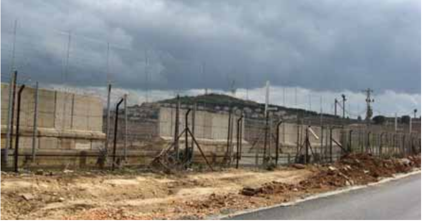
Foto 22 Lübnan-İsrail sınırı ve sınırın ardında Yahudi yerleşimleri (Güney Lübnan-Bint Cübeyl, 15 Mart 2009)