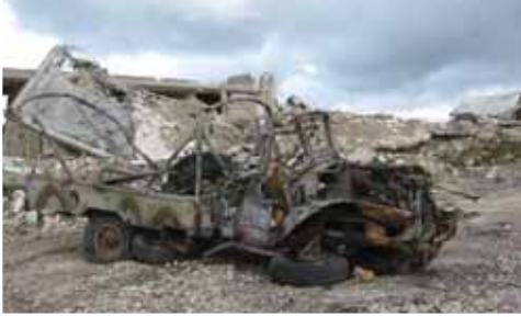
Foto 23 Khiam Gözaltı Merkezi'nden bir görüntü (Güney Lübnan-Hasbeyya, 15 Mart 2009)