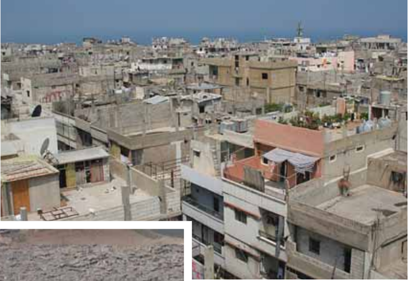
Foto 6 Çatışmalar öncesi Nehru'l-Bârid Kampı (Trablus - Nisan 2007)