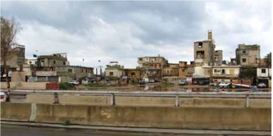
Foto 12 Daha ziyade gecekondü bölgesi olan Güney Beyrut'tan bir görüntü (Beyrut, 15 Mart 2009)