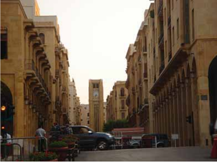
Foto 32 Yıldız (Etoile) Meydanı ve saat kulesinden bir görüntü (Beirut, 9 Ekim 2005)