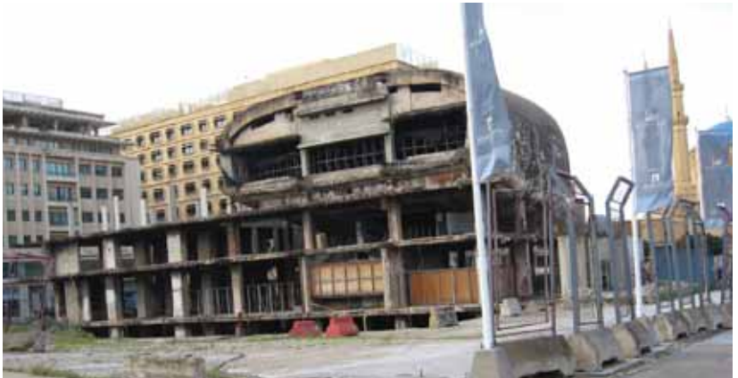
Foto 17 İç savaşta ağır hasar görmüş sinema binası (Beirut, 14 Mart 2009)