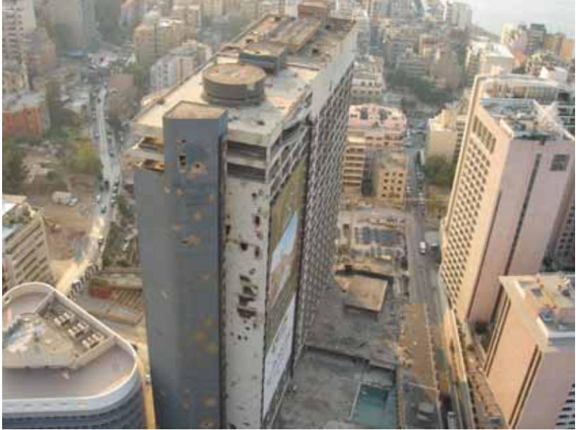
Foto 16 Milis güçleri arasında sık sık el değiştiren Lübnan İç Savaşı'nın sembollerinden Holiday Inn Oteli (Beirut, 10 Ekim 2005)