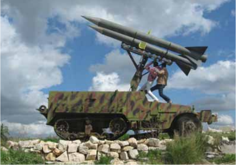
Foto 25 Hizbullah'ın, caddelerin kenarlarında sergilediği ve üzerine füzeler yerleştirdiği İsrail tanklarından biri (Lübnanlılar üzerinde poz veriyor) (Güney Lübnan, 15 Mart 2009)