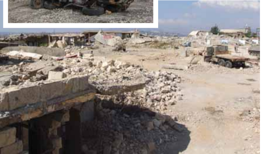
Foto 24 2006'da İsrail saldırılarında yerle bir olan Khiam Gözaltı Merkezi (2006)