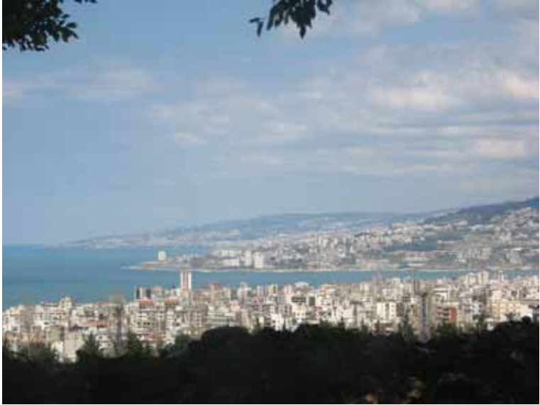
Foto 35 Lübnan Dağları'ndan Akdeniz'e ve şehre bir bakış (Kuzey Lübnan, 16 Mart 2009)