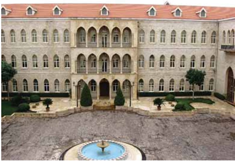
Foto 9 Osmanlı mirası Hükümet Binası'nın iç avlusundan bir görüntü (Beirut, 14 Mart 2009)