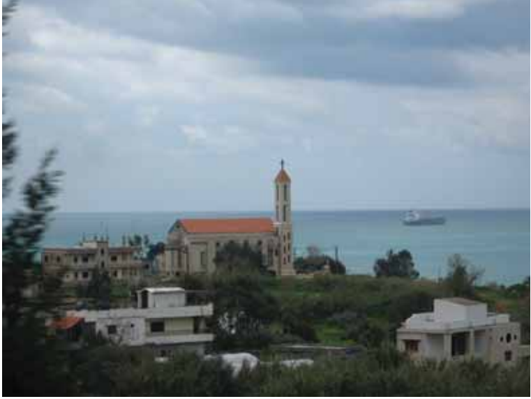
Foto 34 Beyrut-Güney Lübnan yolunda Akdeniz'den bir görüntü (Güney Lübnan, 15 Mart 2009)