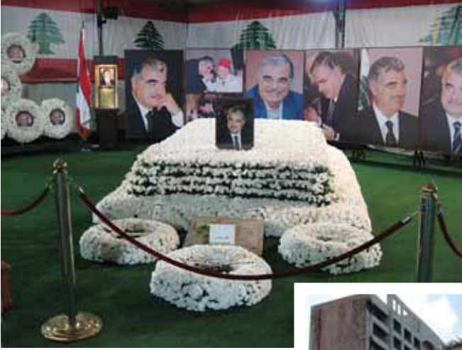
Foto 13 Eski Başbakan Refik Hariri'nin çadır içindeki mezar (Beirut, 14 Mart 2009)