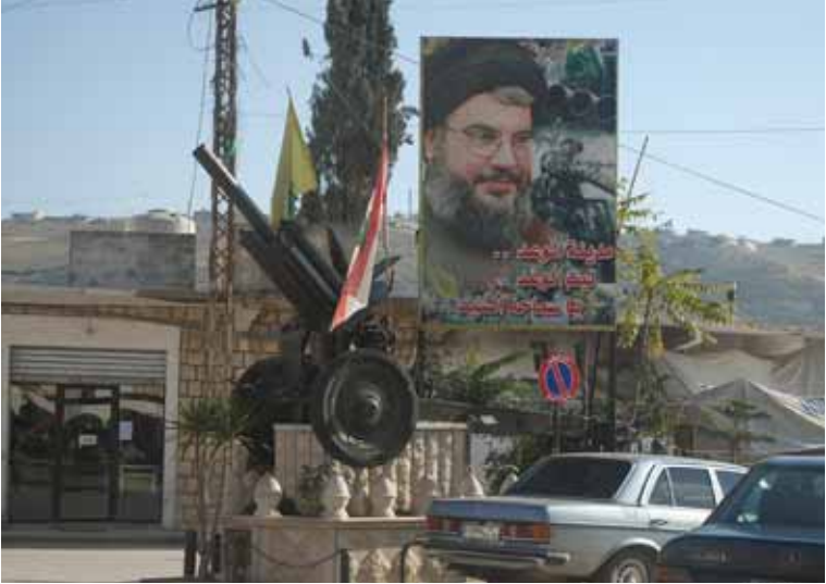
Foto 26 Güney Lübnan caddelerinde sıkça görülen Hizbullah lideri Hasan Nasrallah'ın posterlerinden biri ve bir füzeatar. (Güney Lübnan, 2006)