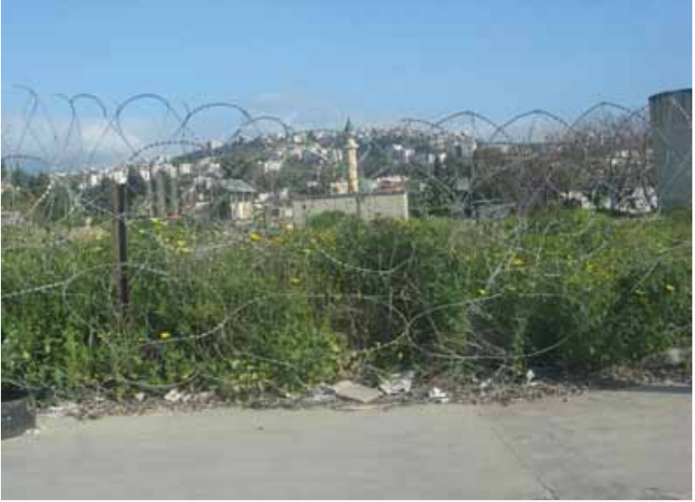
Foto 1 Filistin mülteci kamplarının en büyüğü Ayn el-Hilva. Dört bir yanı dikenli teller ve duvarlarla çevrili kampın dışından bir görüntü (Sayda, 13 Mart 2009)