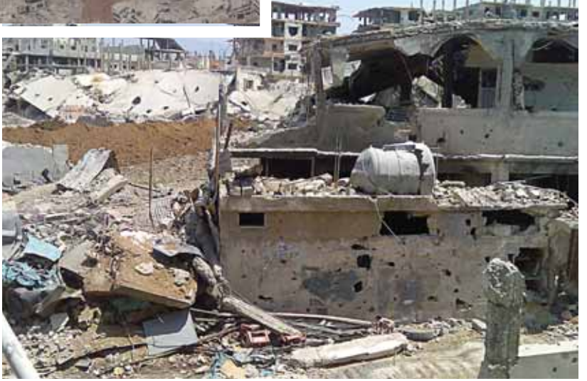
Foto 8 Çatışmalar sonrası Nehru'l-Bârid Kampı'ndan geriye kalanlar (Eylül 2007)