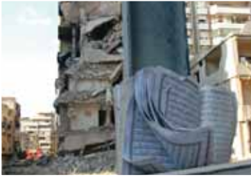
Foto 18-19-20-21 İsrail'in 33 gün süren saldırılarının Lübnan'da yol açtığı yıkım (Temmuz-Ağustos 2006)