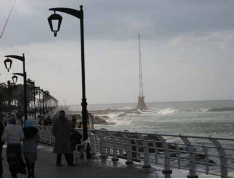
Foto 33 Batı Beyrut sahilinden bir görüntü (Beirut, 14 Mart 2009)