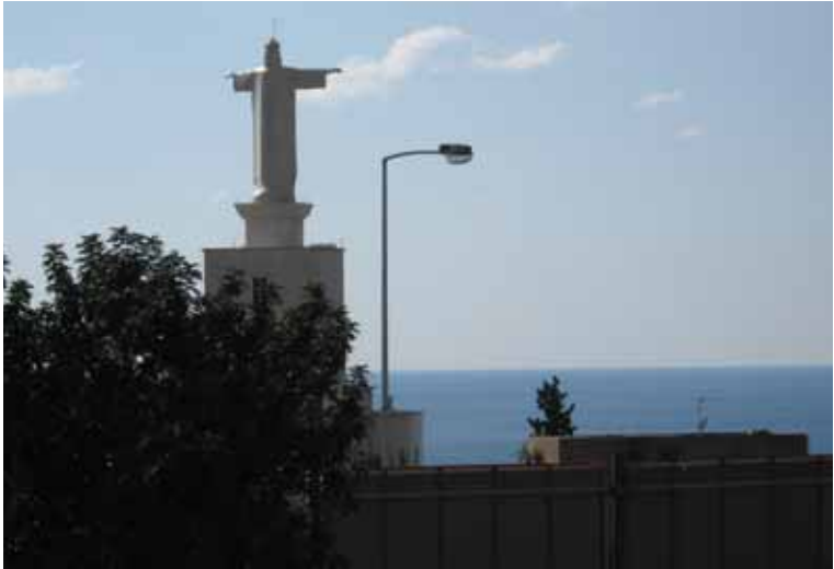
Foto 31 Cebel-i Lübnan'da Hristiyanların yaşadığı bölgede Hz. İsa heykeli (16 Mart 2009)