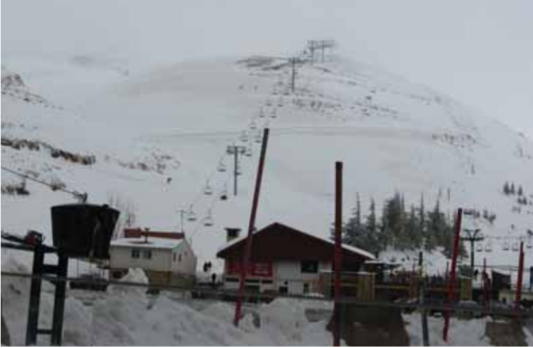
Foto 36 Lübnan Dağları'nın zirvesinden kar manzarası (16 Mart 2009)